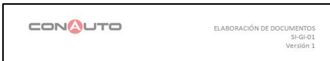
Imagen # 3 Encabezado Resto de páginas