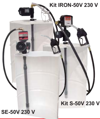
Kit IRON-50V 230 V