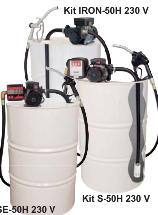
Kit IRON-50H 230 V