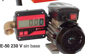
SE-50 230 V sin base