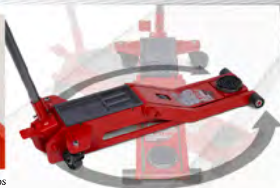
Pedal de aproximación rápida a la carga.

Punto de elevación y plataforma prolongada de acceso extrabajos (48 mm sin platillo) en el modelo T2X que proporcionan una accesibilidad excepcional. Modelo sólo disponible en determinados países.