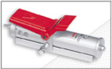
NS-1 Bomba oleoneumática. Opcional