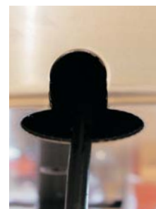
4. Salida horizontal o vertical del cable