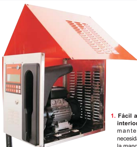
1. Fácil acceso lateral al interior para realizar el mantenimiento, sin necesidad de desconectar la manguera