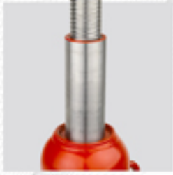
Husillo de aproximación rápida a la carga.