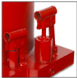
Los modelos MGD-50 y MGD-100 disponen de dos bombas (aproximación y trabajo).