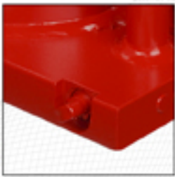
Sobredimensionado espesor de base. Gran robustez y estabilidad.